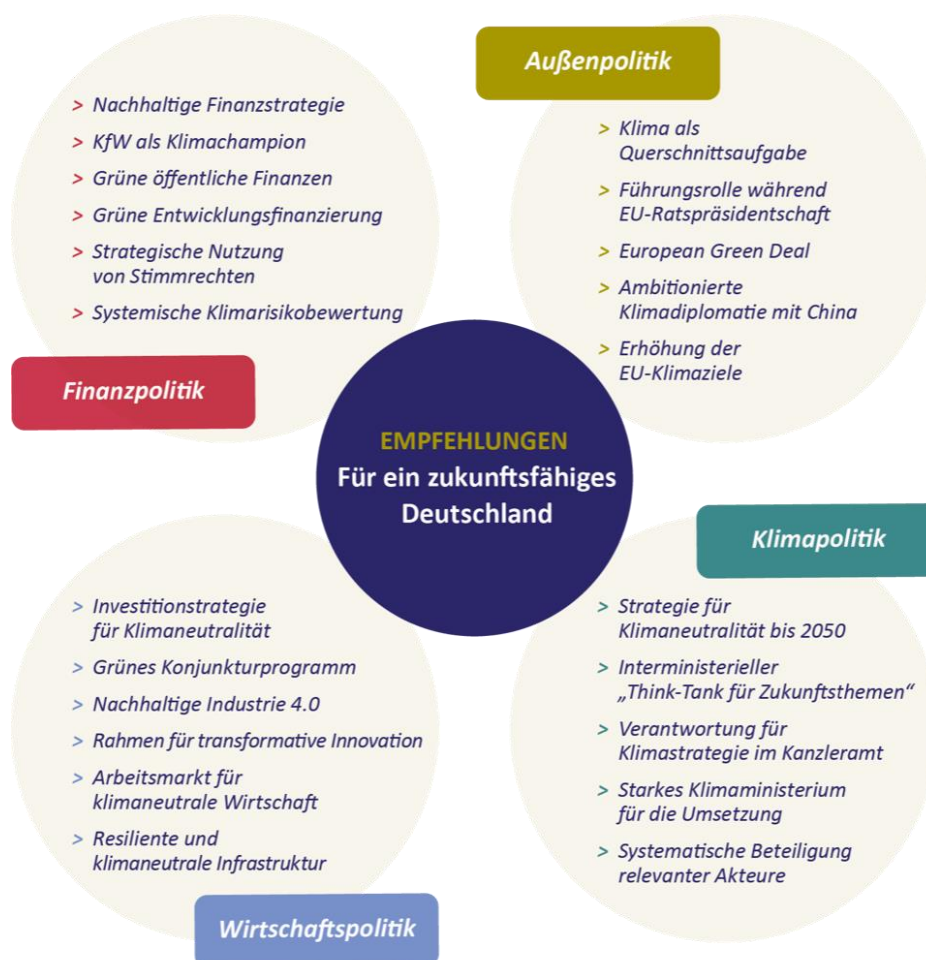
Abbildung 1: Deutschland fit für die Zukunft machen – Empfehlungen